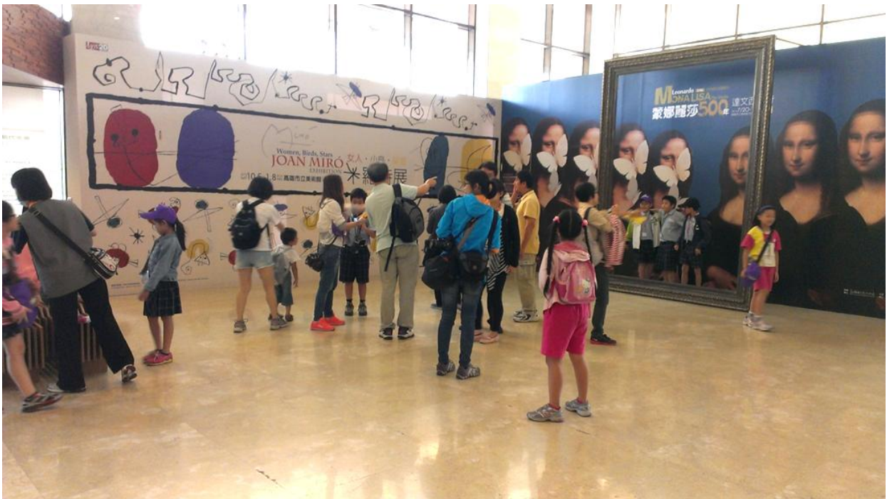
達文西傳奇展覽會場。