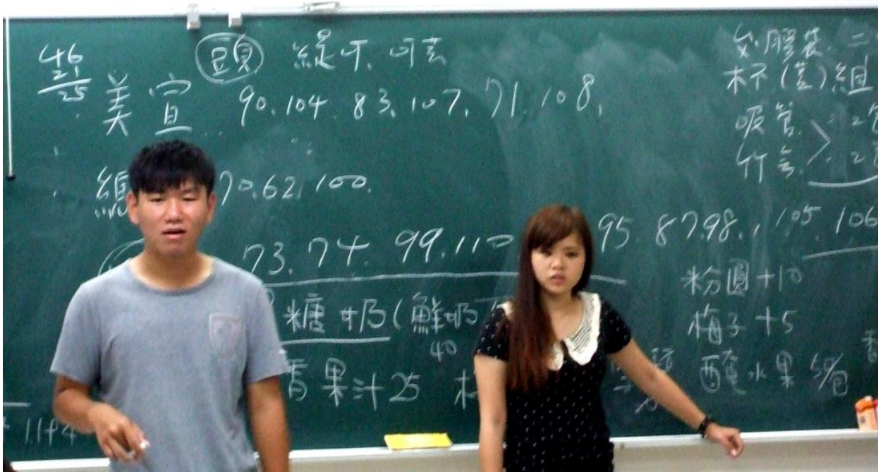
UC3B的班代與園遊會負責人開班會的情景。