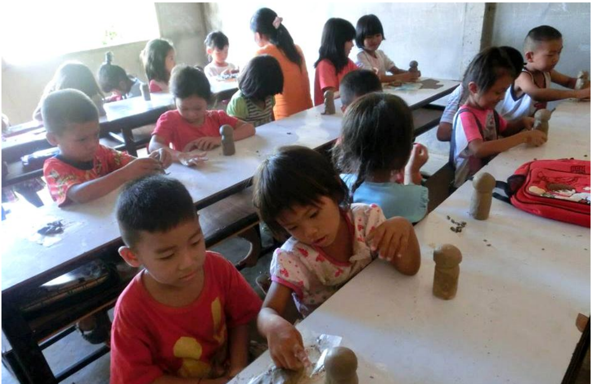
婉茹在課堂上教當地的孩子們捏泥巴。