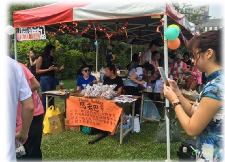
華語中心的攤位，販售美國特色點心Muddy Buddies