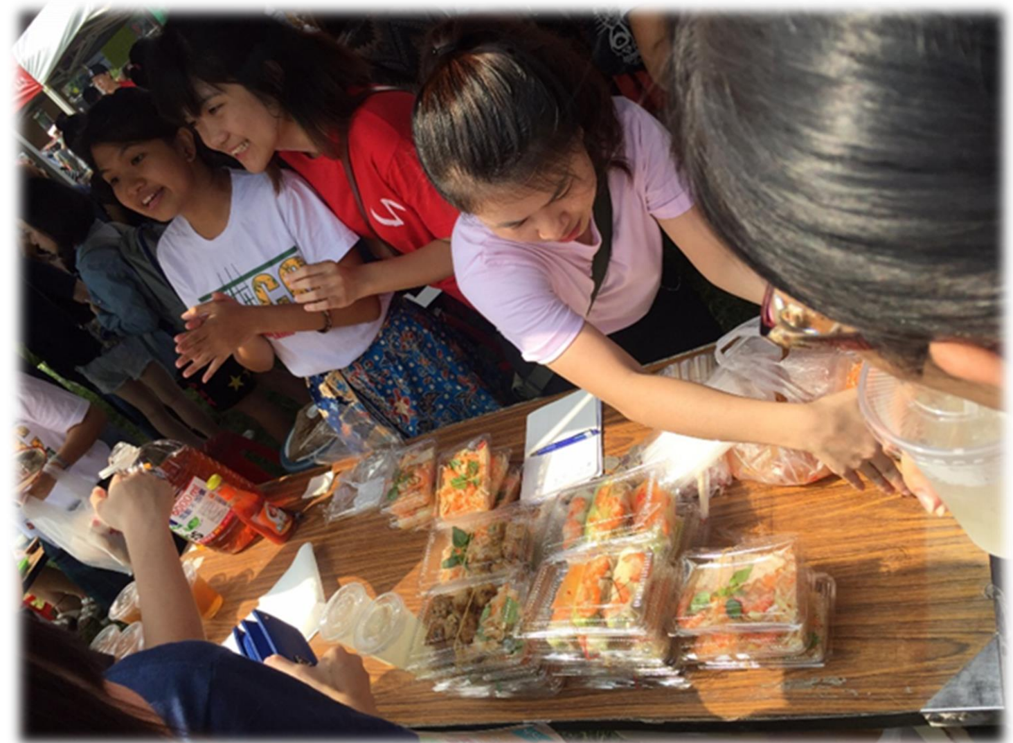
顧客爭購印尼、越南美食，顧攤的同學們露出甜美的笑容