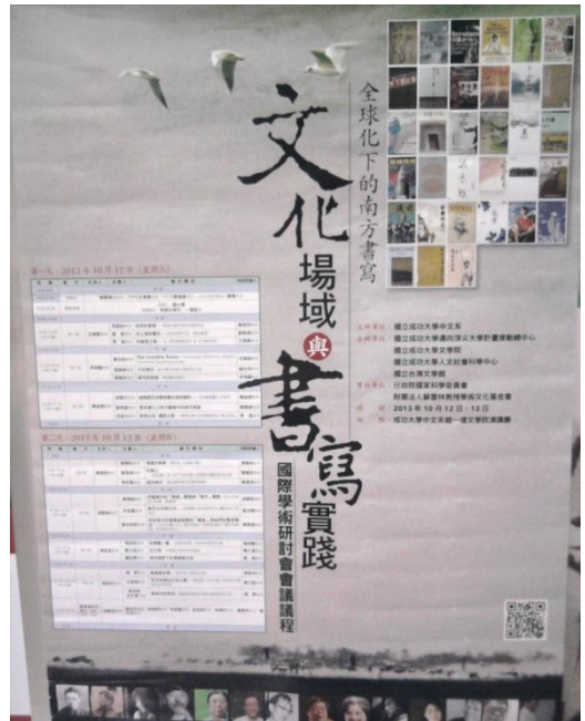
文化場域與書寫實踐學術研討會宣傳海報。

最後，「古文字與古代史國際學術研討會」，則是在中央研究院歷史語言研究所—文物陳列館B1演講廳開講！