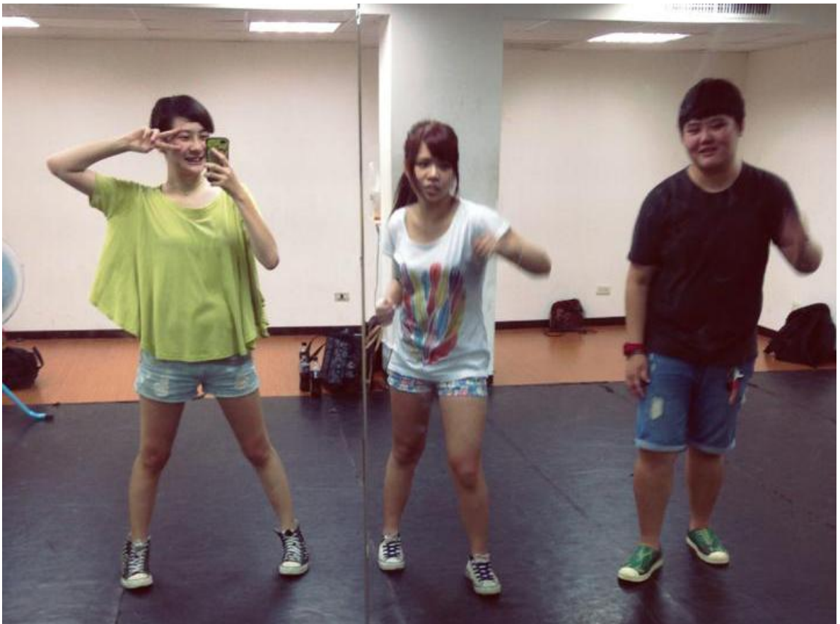
迎新工作人員練舞情況。

此次迎新名稱為「麥克華斯G」，地點選在墾丁的白沙灣，系學會包下整個露營區，要讓大家有個專屬的地方能同樂。