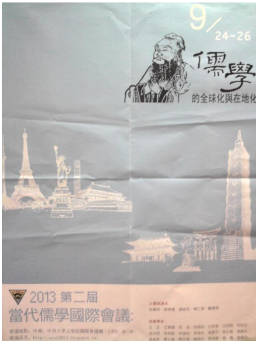
當代儒學國際會議宣傳海報。