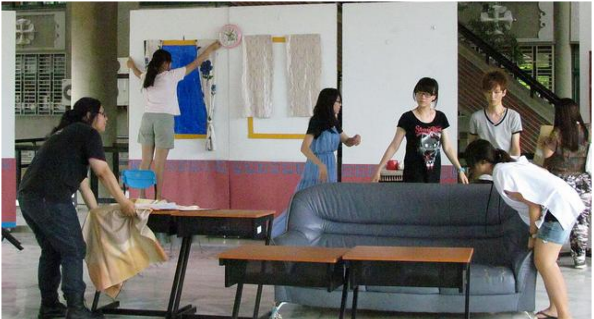
公演團隊認真地佈置道具與彩排。

公演團隊也希望大家能多加支持，期勉學弟妹們延續應華系公演這項傳統，雖然過程辛苦，但是從中能得到許多寶貴的經驗與回憶。