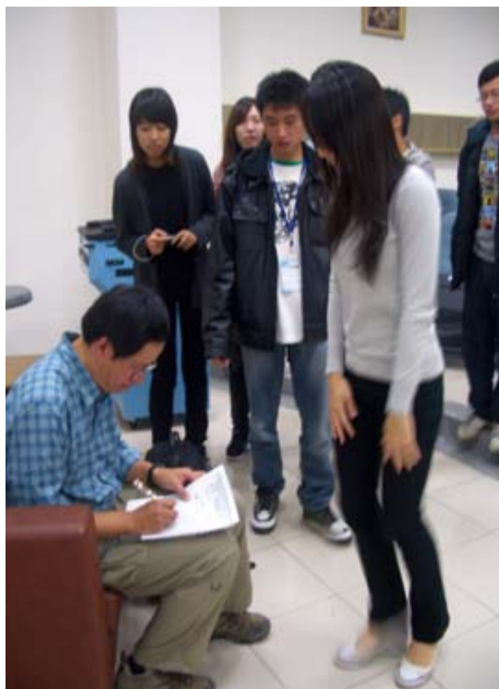
學員們請劉克襄先生簽名。

文藝營帶給每位學員們的成長不僅僅是那些名人的經驗傳承分享，隊員們之間的團隊精神和默契此行的最大收穫。離別固然使人感傷，但此次愛河戀文藝營用最歡樂的氣氛替活動畫下最完美的句點！