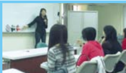
於寒假至台師大參與培訓之同學熱情的試教。

有一個答題的訣竅，不管是書寫或是面試，角度不要侷限於自己原本的答案，而要把角度放在評審老師會希望想要送哪些學生出去代表文藻。